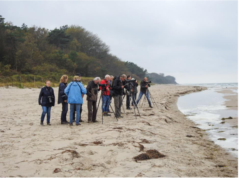
Op het strand turen naar Zwarte Zeeenden en IJseenden.

Onze reis ging verder richting Jasmund en we eindigden bij het schiereiland Pulitz. De zon scheen volop en het was warm, de omgeving was bijzonder mooi, alsof je je in Scandinavië waande. Terwijl we over het water keken en de zon haar licht over de gekleurde herfstbladeren liet stralen vloog er opnieuw een Zeearend voorbij. Met trage vleugelslagen verdween hij over de bomen.