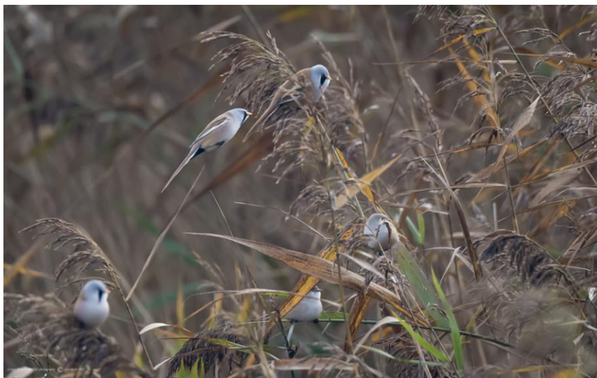
Groep Baardmannetjes (3 mannen en 2 vrouwen).

een brede vaart met dito rietkraag hoorden we steeds Baardmannetjes. Maar de vogels lieten zich niet zien, hoe we ook tuurden over de uitgestrekte rietvelden. Na veel geduld lieten de Baardmannetjes zich uiteindelijk zien; er zaten er wel een stuk of tien. Ook werden er Pimpel- en Koolmezen in het riet gezien. Ringmussen vlogen rond en de Raaf liet zich zien en horen. Een Zwarte Roodstaart en Witte Kwikstaart zaten op de brug en net voordat we verder wilden gaan hoorde Peter een Grauwe Gors zingen; de zang lijkt op een rammelende bos sleutels. Iedereen weer uit de auto's en op zoek naar deze (voor ons land zeldzame) zanger. Al snel werd hij gevonden en hij was niet alleen. Een stuk of vier Grauwe Gorzen vlogen samen met enkele Geelgorzen van struik naar boom en andersom.