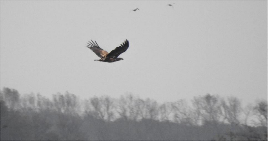
Overal zagen we solitaire Zeearenden; zowel volwassen als juveniele en onvolwassen (foto) exemplaren.