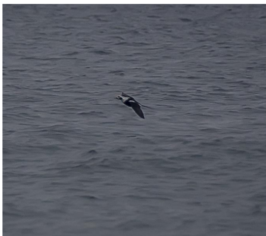
Mannetje IJseend.