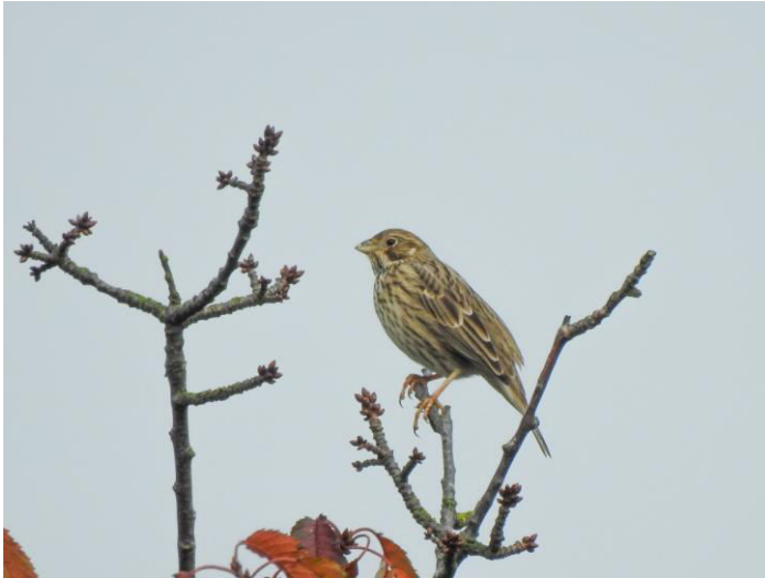
Op een aantal plaatsen zagen we kleine groepjes Grauwe Gorzen die regelmatig zaten te zingen.

Over de brug kwamen we op het eiland Ummanz. Het visrestaurant nodigde uit om daar met elkaar te eten die avond, dus werd er gereserveerd voor 16 personen. We reden richting Tankow en zagen onderweg een ruig gebied met veel wilde planten waar enorm veel zangvogeltjes foerageerden. Gestopt en het bleek een grote groep Kneutjes met daarin enkele Geelgorzen, een Grauwe Gors, enkele Ringmussen en een Groenling. Aan de overkant van de weg liep een groep van 8 Reeën die zich aan ons vogelaars niet stoorden en rustig bleven grazen. Een grote observatiehut bij Tankow gaf aan dat hier de Kraanvogels te observeren zijn. We liepen een boerenlandpad af en zagen op een bouwland een groep van ongeveer 80 Kraanvogels staan. Hun karakteristieke roep drong ver door in de weidse omgeving. Uiteindelijk vielen er die avond ongeveer 490 Kraanvogels in. We hadden op meer gehoopt. Er kwamen grote groepen Kolganzen invallen om hier de nacht door te brengen en er zat een Zeearend waardoor alle ganzen op de vleugels gingen om na een paar rondjes opnieuw op het water neer te strijken. Een enorme groep Kieviten met daarboven een wolk van zeker 2.500 Goudplevieren deden hetzelfde. Oeverlopers, Bonte Strandlopers, twee Slechtvalken, Grote Zaagbekken, Pijlstaarten, Toendrarietganzen en een Zwarte Ruiters werden hier eveneens gespot. Een waterral liet van zich horen; wij mochten dit alles aanschouwen en genieten er van.