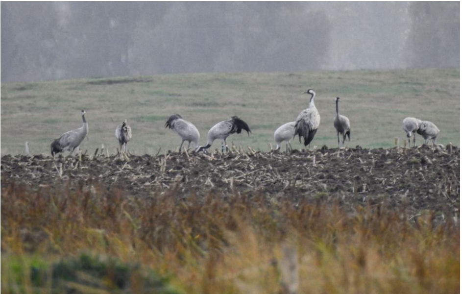
Groepje Kraanvogels op Ummanz.