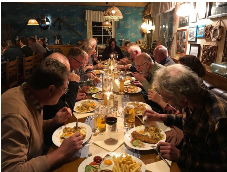
Diner met onder andere lekkere vis op Ummanz.

niet meer op. Diepholz hebben we niet meer aangedaan. Erg spijtig, want bij het verlaten van Rügen zagen we een groep van circa 2.100 Kraanvogels met nog 5 Kleine Zwanen aan ons voorbij gaan. Dit was op dezelfde plek waar we die vrijdag niet konden stoppen. Achteraf hadden we hier nog even hierlijk met de scopen en camera's van kunnen genieten. Maar ondanks deze pech was het een prachtige en gezellige reis. We hebben in totaal deze dagen 102 verschillende soorten vogels mogen spotten. Het was een zeer geslaagde excursie naar het mooie eiland Rügen.