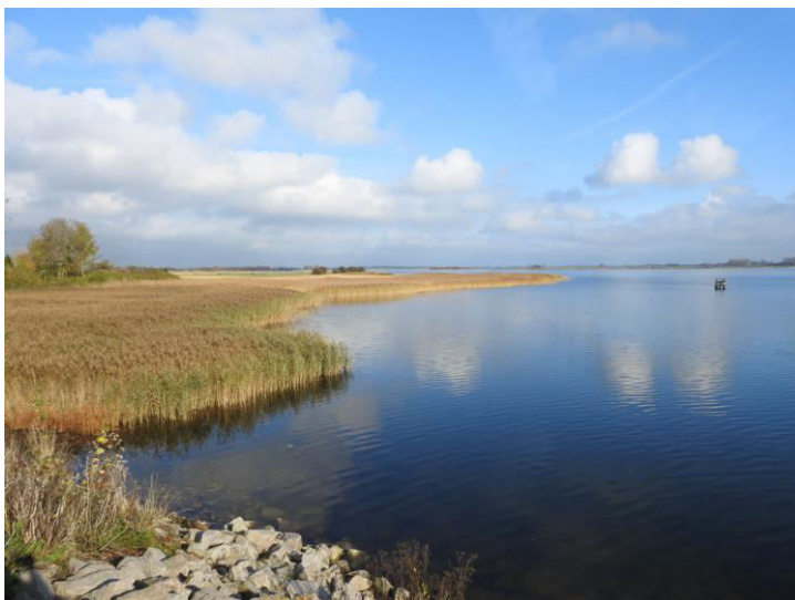
Rügen is eigenlijk een complex van (schier)eilanden achter een lange strandwal en omgeven door diverse brakke meren.