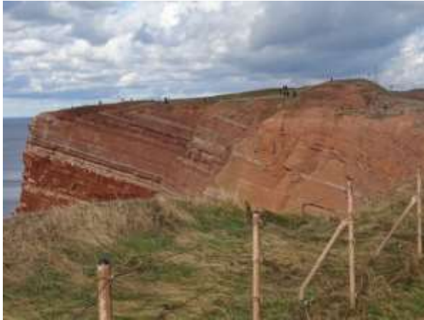
Een deel van het Oberland met gras en rode zandsteen

Rond het eindpunt van het eiland, bij de Dikke Anna met strekdam, vlogen een 7-tal volwassen Jan van Genten rond. En op de rotsen zaten nog 2 jonge Jan van Genten. Met de kijkers konden we zien hoe sierlijk en acrobatisch de vogels door de lucht scheerden.