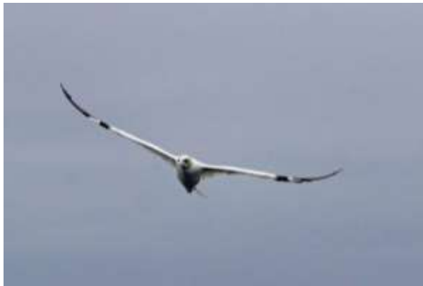
Een volwassen Jan van Gent

Rond het eindpunt van het eiland, bij de Dikke Anna met strekdam, vlogen een 7-tal volwassen Jan van Genten rond. En op de rotsen zaten nog 2 jonge Jan van Genten. Met de kijkers konden we zien hoe sierlijk en acrobatisch de vogels door de lucht scheerden.