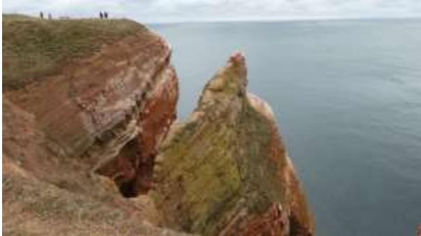
De rode zandsteen kliffen

woningen, ook het sportpark, de brandweerkazerne en het ziekenhuis te vinden.