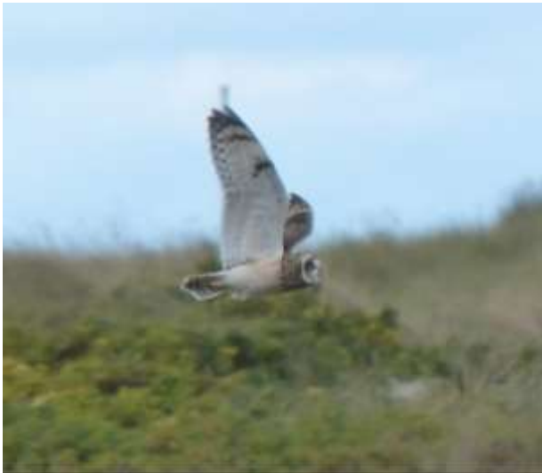
Velduil; een gele iris en zwarte polsvlek!

Na deze escapades van het Bokje weer verder struinen over het eilandje op zoek naar (hoe kan het ?) vogels. He daar vliegt wat op !!!!! Grote opwinding. En jawel hoor de Velduil vliegt zomaar op en is goed te zien met het blote oog , de kijker en met camera, als je snel bent en geluk hebt met het afdrukken.