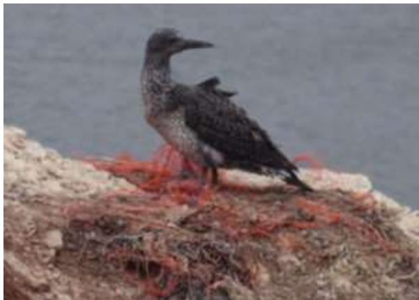
Een onvolwassen Jan van Gent op restanten van een nest.

In een grasland op het Oberland ontdekte Jos al gauw enkele Goudplevieren die in hun winterkleed nauwelijks opvielen tussen het groene en het gele gras. Na enige tijd zoeken bleken er 8 vogels te zitten. We konden ze prachtig in onze telescopen bekijken.