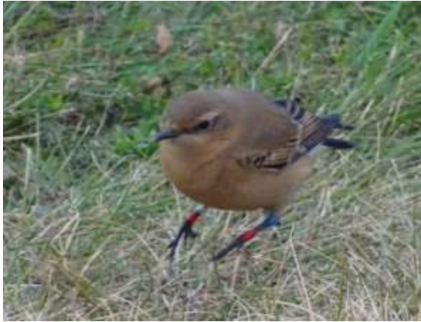
Tapuit met 5 kleurringen (op het linker pootje, voor de kijker, zit nog een blauwe ring verborgen achter de buik)

En zoals we al eerder zagen ook hier weer de nodige aantallen Vinken, Kepen en Roodborsten. Onder het wandelen en zoeken naar vogels (daar zijn we voor) zien we een Zwarte Roodstaart en niet zomaar één, maar zoals achter af bleek een Oosterse Zwarte Roodstaart.