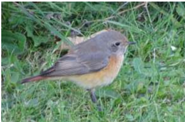
Oosterse Zwarte Roodstaart

En zoals we al eerder zagen ook hier weer de nodige aantallen Vinken, Kepen en Roodborsten. Onder het wandelen en zoeken naar vogels (daar zijn we voor) zien we een Zwarte Roodstaart en niet zomaar één, maar zoals achter af bleek een Oosterse Zwarte Roodstaart.