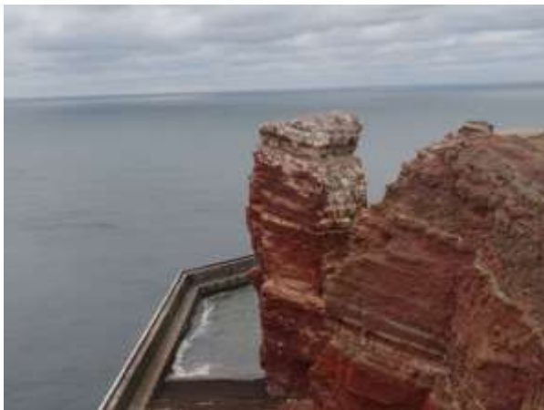
De Dikke Anna

Op de rode rotsen van zandsteen lagen en hingen de resten van vogels en hun nesten. In de zomer broeden hier diverse zeevogels als Alk, Zeekoeten, Drieteenmeeuw en Jan van Gent. De Zeekoeten gebruiken daarbij netten en allerlei ander touw om hun nest te bouwen. Onder andere op de wanden van de Dikke Anna, een solitaire rotspilaar. Het gevolg hiervan is dat de jonge vogels soms verstrikt raken, vallen en blijven hangen in de netten. Dit is funest want de ouders kunnen ze dan niet meer voeren en ontsnappen is onmogelijk.