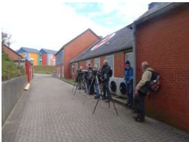
Op de uitkijk en zoeken naar de Bladkoning

De dag van vertrek naar Nederland. s' Morgens om 08:00 verzamelen voor het appartement om dan met z'n allen naar het Oberland op zoek naar nog meer soorten. Wat helaas niet gelukt is. Toch nog even bij het ziekenhuis kijken of de bladkoning er nog zit.