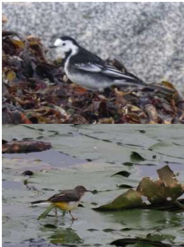
Rouwkwikstaart (boven) en Grote Gele Kwikstaart

Aan het strandje achter de heliport zaten noch enkele interessante soorten; hier verjoeg de Rouwkwikstaart alle andere kwikstaarten, zoals de Witte- en de Grote Gele Kwikstaart.