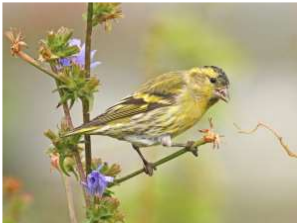
Sijs op Chicorei