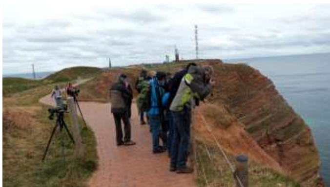
Beflijster spotten op het strand 60 m loodrecht naar beneden

Verder vond ik het een heel geslaagd weekend met toffe gasten en een gezellige sfeer. Er is geen slecht woord gevallen volgens mij. Helgoland een leuk vogeleiland met een heel apart sfeertje en met heel veel vogelaars. Het eiland zelf heeft naast dit vogelgebeuren enkel een aantal taxfree shops waar cosmetica/ drank en sigaretten te koop worden aangeboden. Helgoland zelf is leuk om even een paar nachtjes aan te leggen en van de zee en de vogels te genieten maar ook niet meer dan dat want de gekleurde huisjes heb je nog wel een keer gezien.